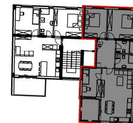
TLOCRT 3. KATA